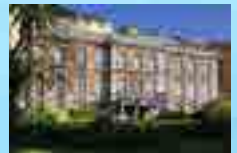
MAHP (Musée d'Art et d'Histoire de Provence)