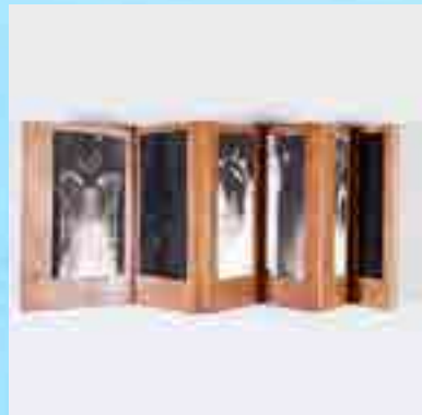
Livres objets et d'artistes