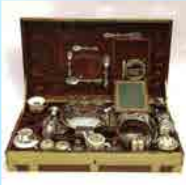
Coffret Marie- Antoinette