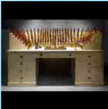
Orgue à parfum