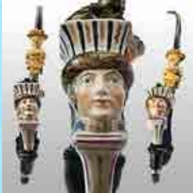
Pipes à fumer