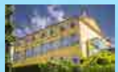
MIP (Musée International de la Parfumerie)