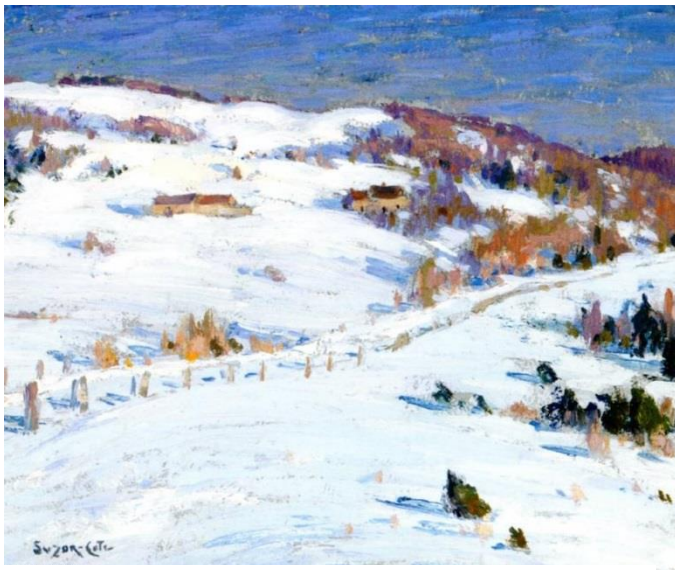
Marc Aurèle Foy Suzor-Coté, "Ferme en montagnes" 1909 DP

Certains des grands poètes de la modernité furent aussi des chanteurs. Il suffit de citer Félix Leclerc, grand poète baladin de la nature et Gilles Vigneault, l'homme de la Côte-Nord et des chasses qui furent tous deux partisans de la souveraineté. Léonard Cohen, natif de Montréal qui, même s'il écrit en anglais, fait entendre l'écho de la contre-culture américaine et est célébré comme l'un des poètes