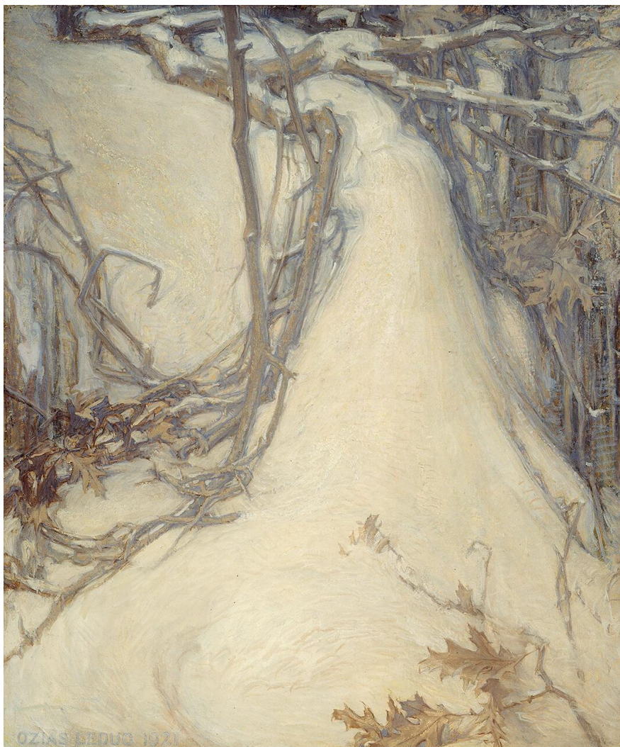
Oziás Leduc, L'heure mauve, 1921 Musée des beaux-arts de Montréal DP

La batèche ma mère c'est notre vie de vie batèche au cœur fier à tout rompre batèche à la main inusable batèche à la tête de braconnage dans nos montagnes batèche de mon grand-père dans le noir analphabète batèche de mon père rongé de veilles batèche de moi dans mes yeux d'enfant