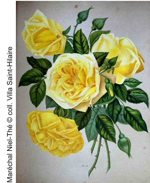
Maréchal Niel-Thé

« Je vous salue, ô roses, étoiles solennelles. Roses, roses joyaux vivants de l'infini, bouches, seins, vagues âmes parfumées, larmes, baisers ! grains et pollen de lune, ô doux lotus sur les étangs de l'âme, je vous salue, étoiles solennelles ».