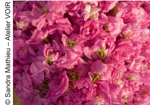
© Sandra Mathieu – Atelier VOIR

Cote : 668.509 01 PAR Art de vivre – Parfums et cosmétiques