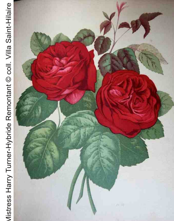
Mistress Harry Turner-Hybride Remontant

Cote : 635.933 73 ROS Jardin – Jardinage